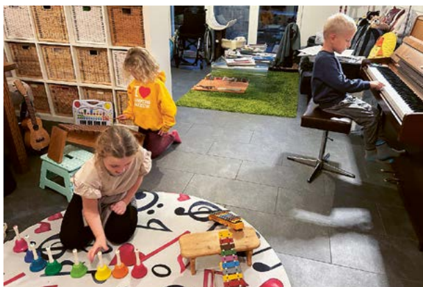
Auch mit andern Instrumenten lässt sich das Lied und die Tonleiter spielen. Das macht Spass!