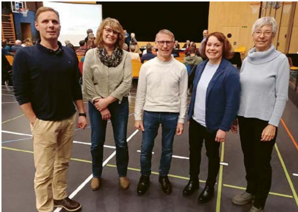
Der aktuelle Kirchenrat nach der KG-Versammlung

Zwei Nachkredite zur Rechnung 2024 und der Voranschlag 2026 mit der Beibehaltung des bisherigen Steuerfusses wurden diskussionslos genehmigt. Abschliessend informierte die Präsidentin noch über einige Aktualitäten und Aktivitäten in unserer Pfarrei.