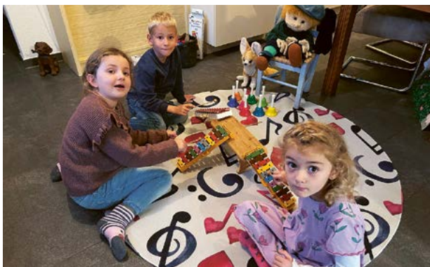
Mit dem «Treppenlied» lernen schon die Jüngsten spielerisch die Tonleiter