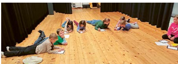
Nach der ersten Proben dürfen die Kinder weitere Ideen aufschreiben, die dann ins Musical eingebaut werden