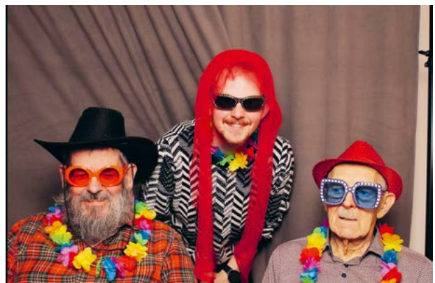
... bereiteten zusätzlichen Spass.