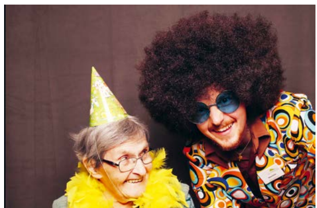
Bilder aus der Fotobox...