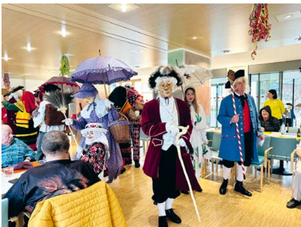
Alle freuten sich über das bunte Treiben der Steiner Rott.