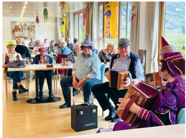
Die Örgelifründe Brunnen sorgten für beste Unterhaltung.