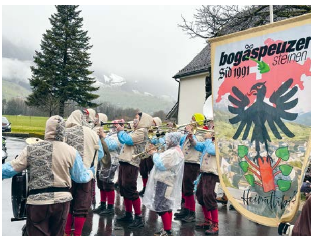
Trotz garstigem Wetter sorgten die Bogäspeuzer für eine tolle Stimmung.