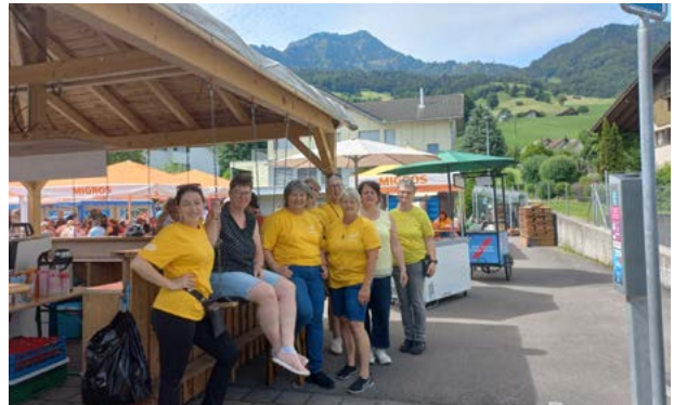
Frauenpower vom Frauenverein Lauerz