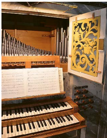
Blick in die Kirchenorgel

Gegen Abend wusste auch der Sagenerzähler Guido Schuler viel Spannendes über die Kirchengeschichte und die Sagen rund um Lauerz zu berichten.