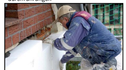
Isolierung der Gebäudehülle