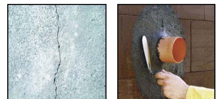
Abdichtung von Rissen und Leitungsdurchführungen